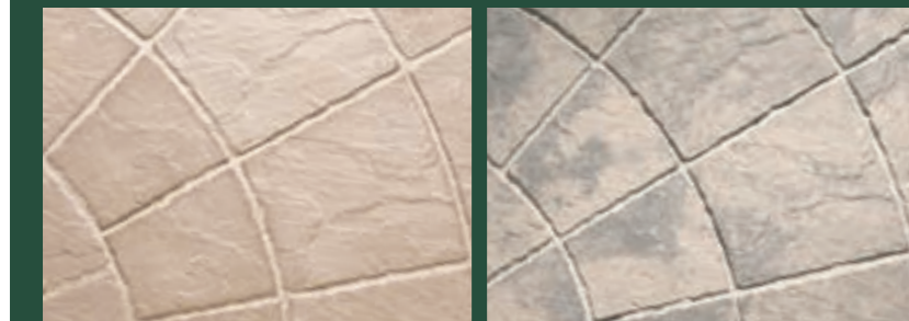
オールドストーン