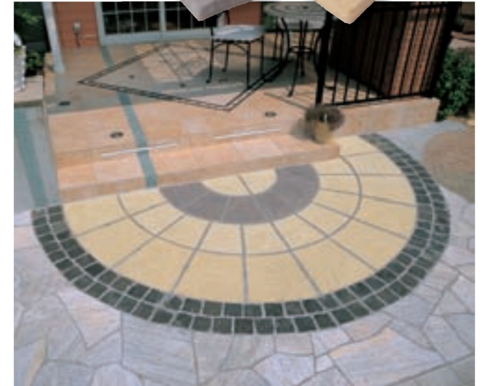
ライムイエロー、ウォームグレー