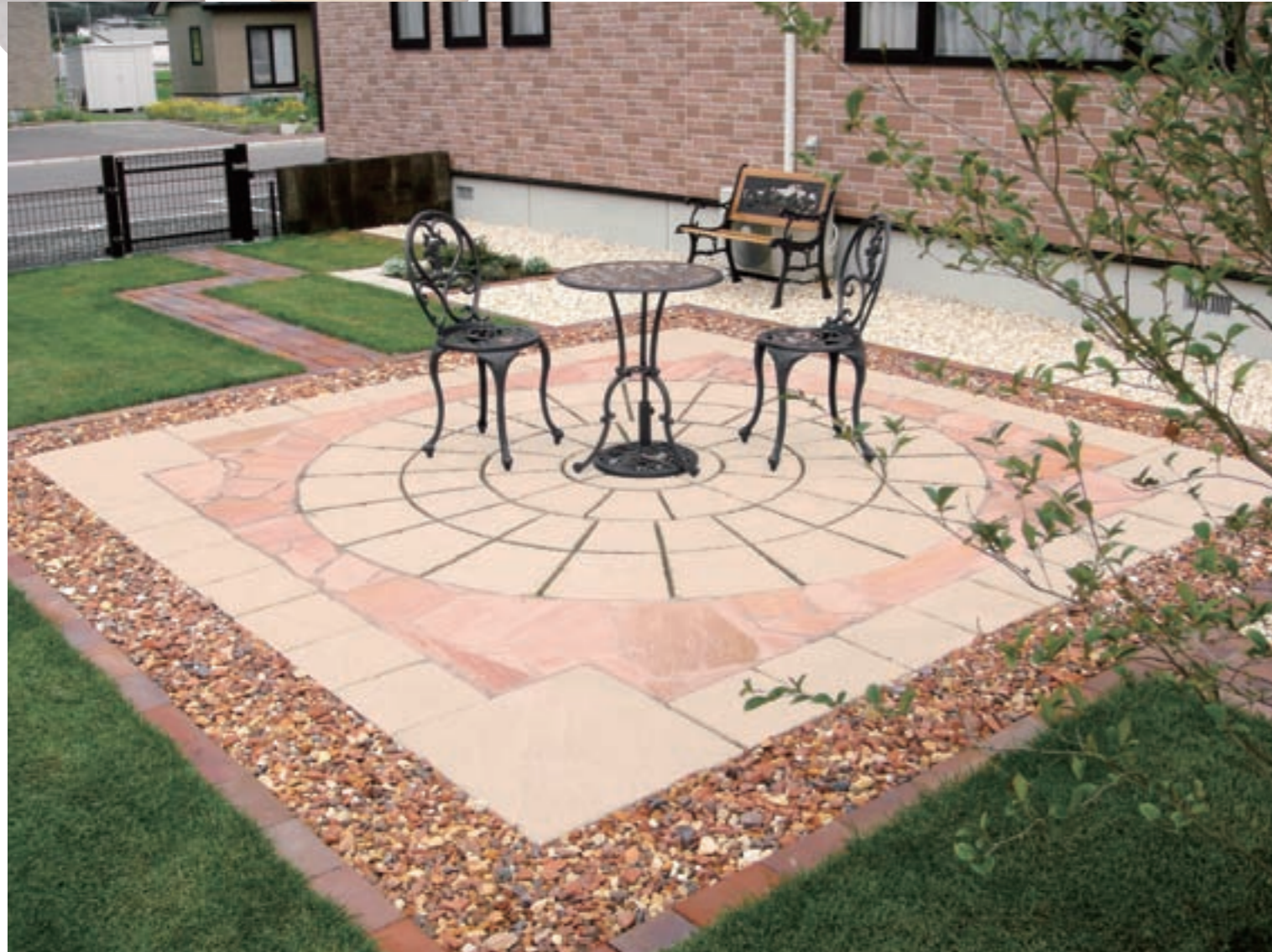
オールドストーン

円形・半円形を簡単に造れる、天然石調の舗装材。 曲線を活かして、個性豊かなガーデン空間を演出。