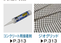
コンクリート用接着剤 ▶P.313