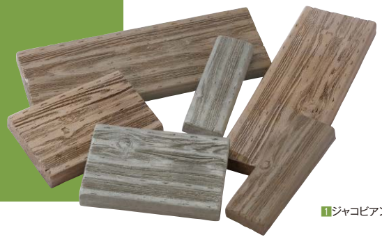
1 ジャコピアングレー

古木のようなヴィンテージ感のある杉板柄の コンクリート製のデザインペイパーです。 積み重ねた「時」を感じる美しい木目に 仕上がっています。