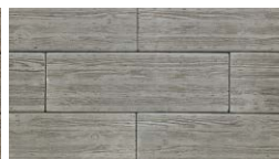
ジャコピアングレー