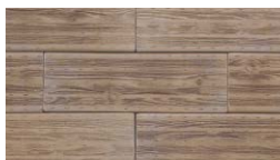
ハニーアイボリー