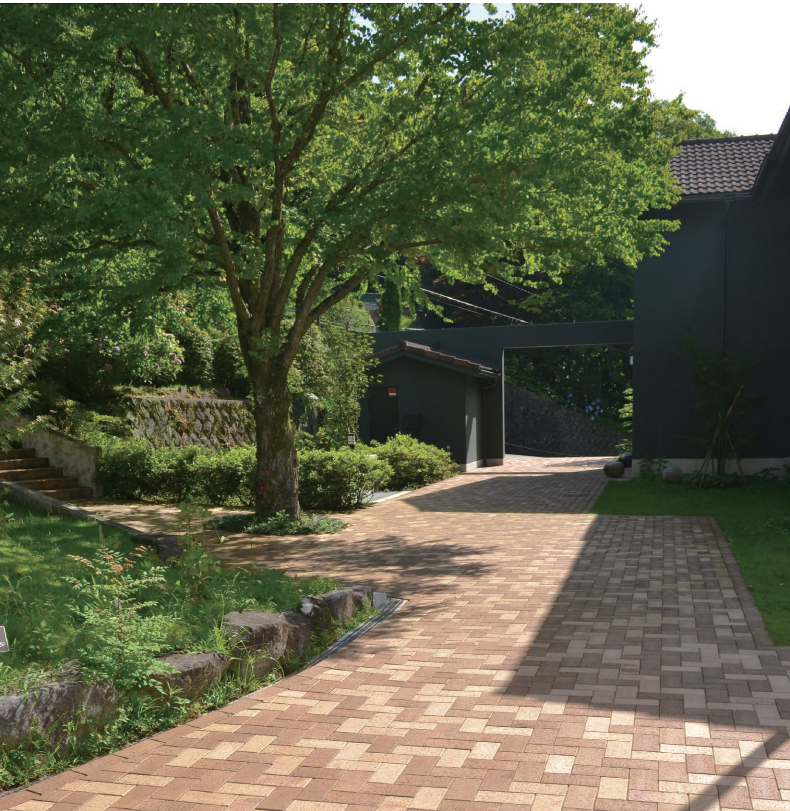
オーランド、カプチーノ