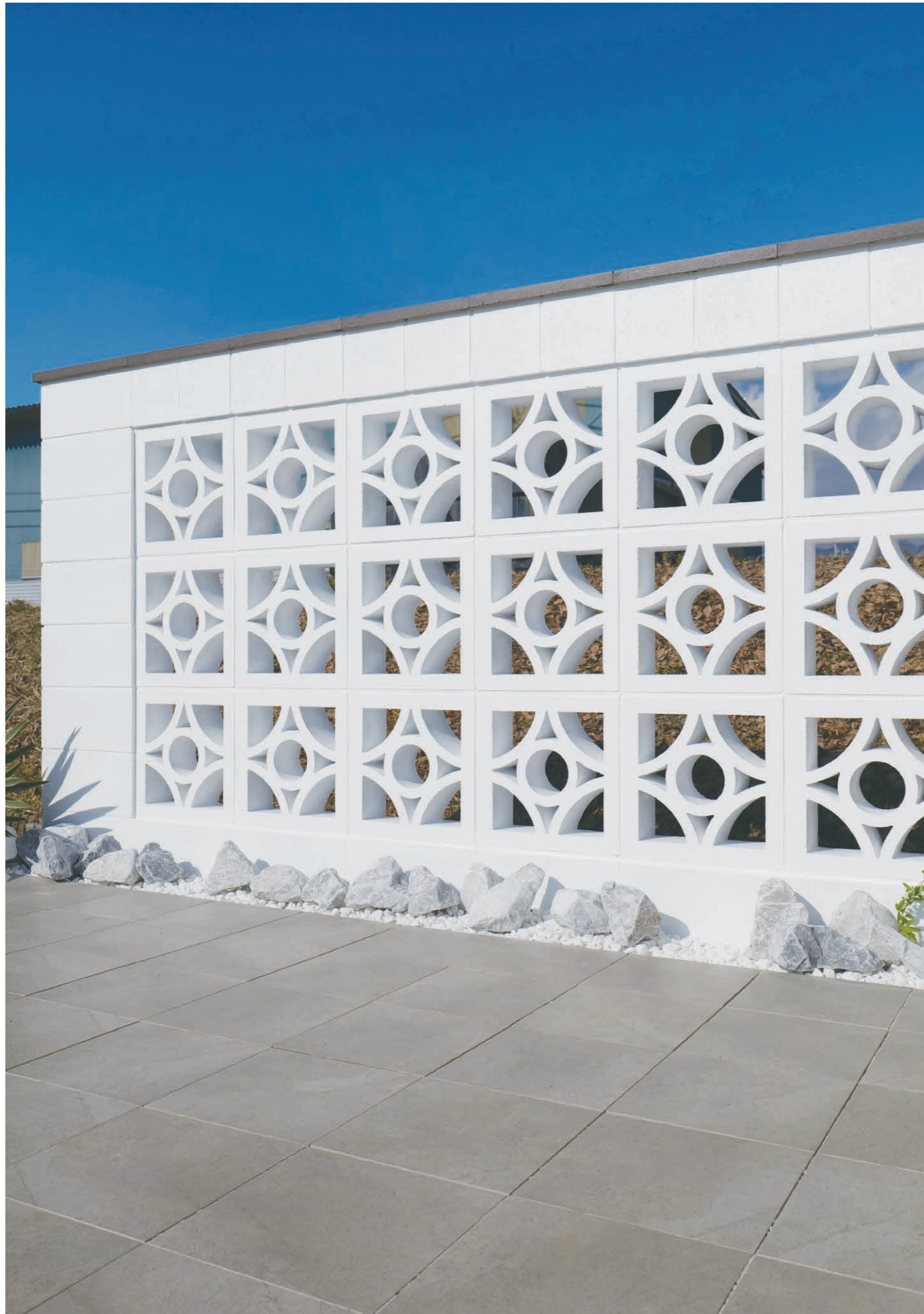
※写真の製品は、現場にて塗装しています。