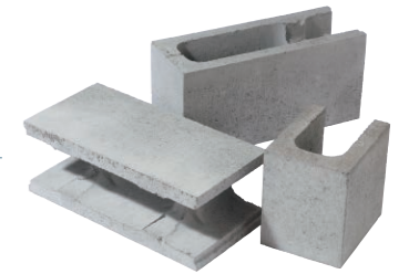
デザインブロック

塀の三方向(上と左右)をRECOMユニットで構築することで スカシブロックの連続使用が可能になるシステムです。