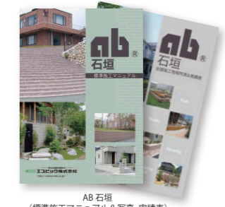
ガーデンアイテム

景観と安全のベストバランス 【セットバック量=20mm】 ABリテインは、乾式施工(無補強)で、最大高さ約1.1mまでの擁壁に適用できます。敷地の有効活用と安全性の面でバランスの良い擁壁が築造できます。 ・左図は砂質土、上載荷重なしでの施工断面の一例です。 ・土質や上載荷重等の現場条件によっては、ジオグリッドによる補強が必要です。 ・詳しい設計・施工方法は、『AB石垣標準施工マニュアル』をご覧ください。