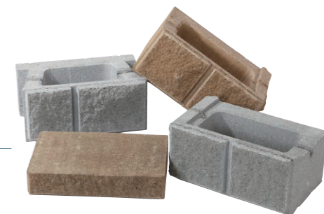
デザインブロック

地盤の高低差をしっかりと守り、 自然石積のイメージに近づけた意匠が特長の乾式型擁壁ブロックです。