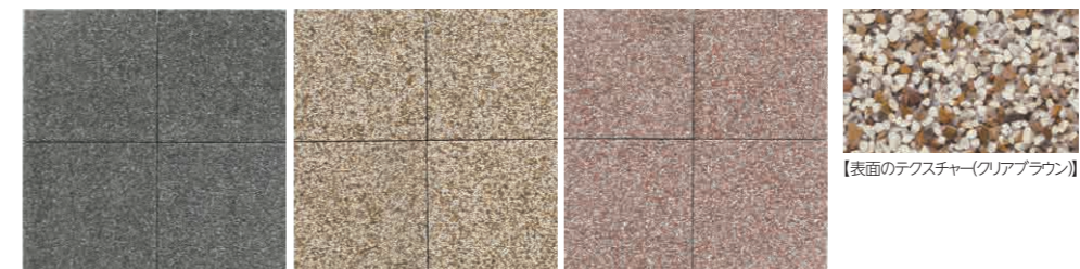
ラスティブラック クリアブラウン 遮熱性 カメラピンク