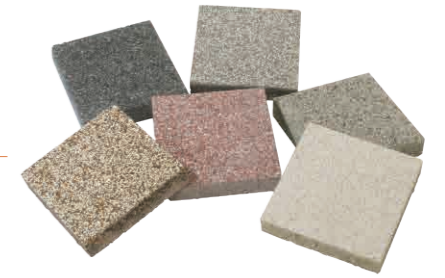
デザインブロック

厳選した天然石を意匠面で洗い出しました。 路面の温度上昇を抑制する遮熱機能と透水機能を有しています。