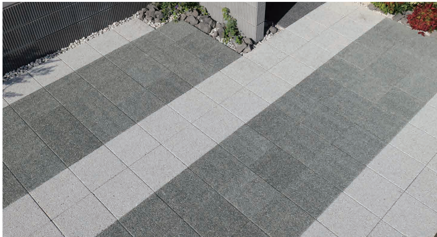
フレッシュホワイト、ラスティブラック