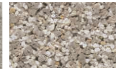
【表面のテクスチャー(シルバー)】