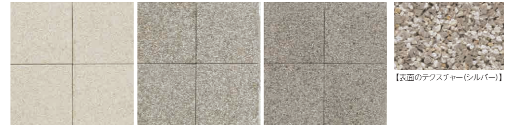
フレッシュホワイト 遮熱性 シルバー 遮熱性 アーバングレー