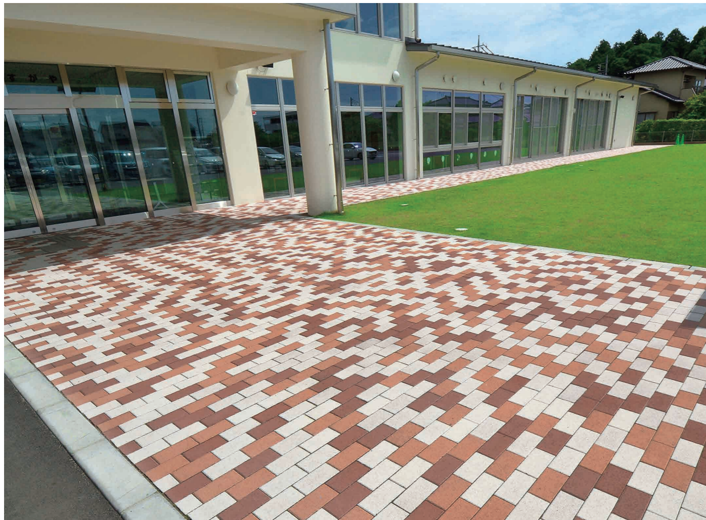
R-1, R-2, G-1