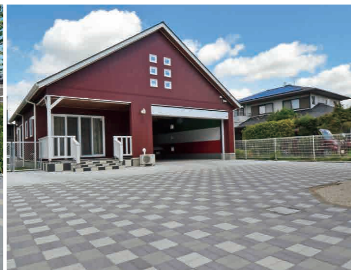
G-1, G-2, G-3