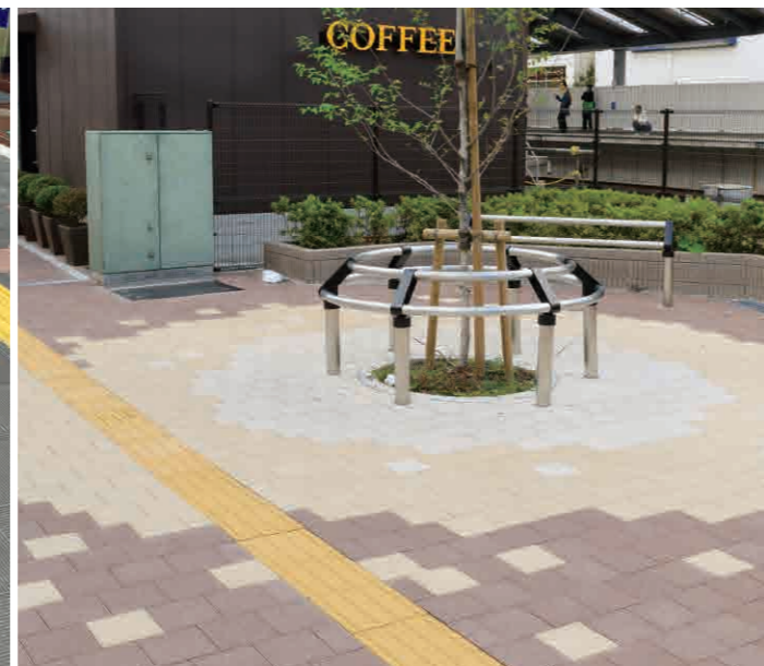
ミルクホワイト、クリームイエロー、ヘーゼルブラウン(226E)