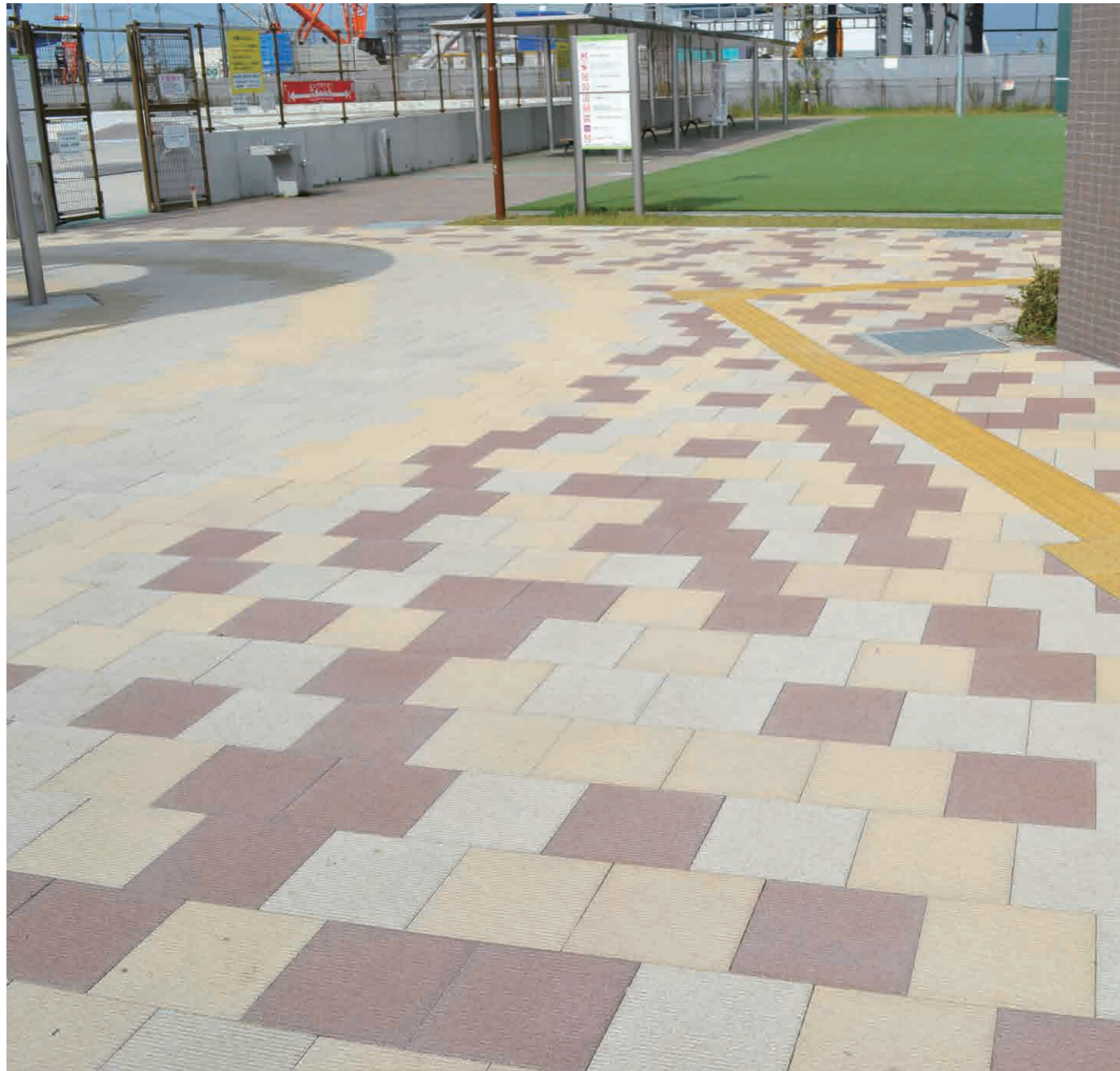
ミルクホワイト、クリームイエロー、ヘーゼルブラウン(336E)