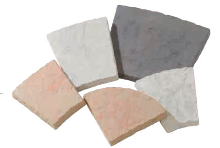
デザインブロック

円形、半円形に仕上がるようあらかじめパーツが作られているので並べるだけで美しい仕上がり。サークルの廻りに植栽を植えることでより印象的な演出ができます。