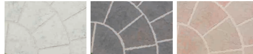
スモークホワイト