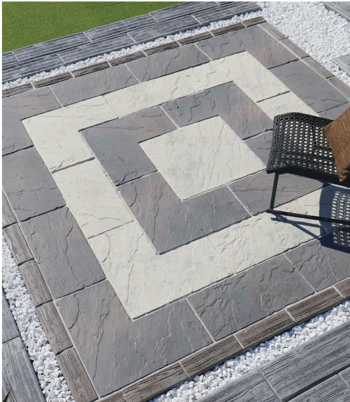
スモークホワイト、チャコールグレイ