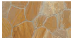
ラステックイエロー