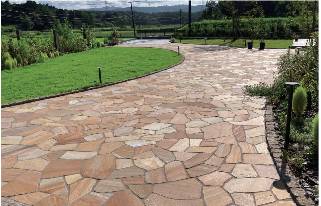
ラステックイエロー