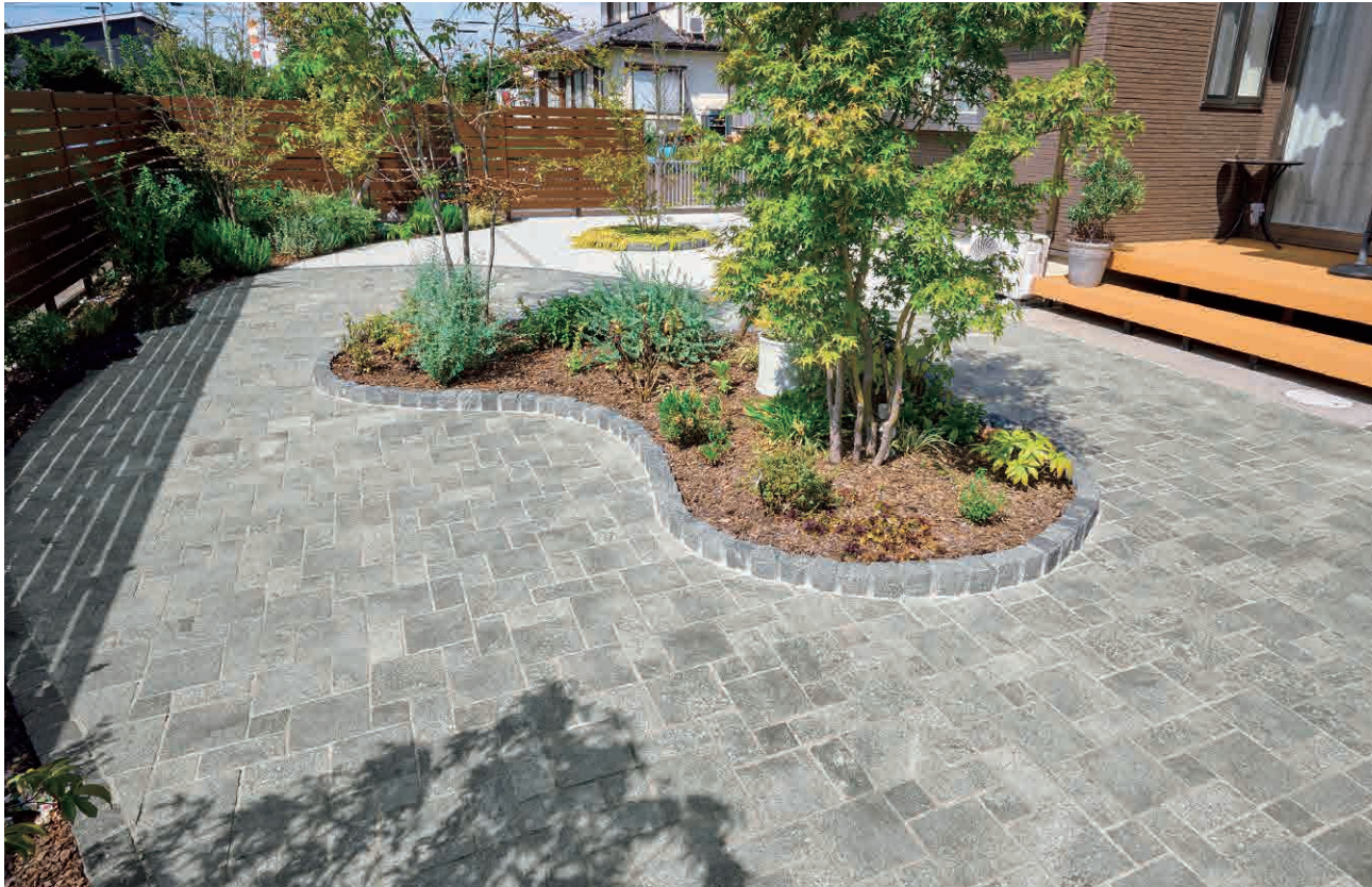
シャイングリーン