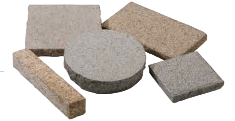
デザインブロック

高い寸法精度と丁寧な仕上げを施した至高の御影石です。 お庭の高級感を底上げします。