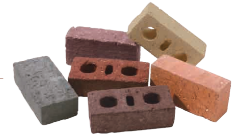
デザインブロック

焼き菓子をイメージさせるれんがです。 表面の豊かな表情が気品を感じさせてくれます。