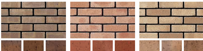
アンチックシルバー