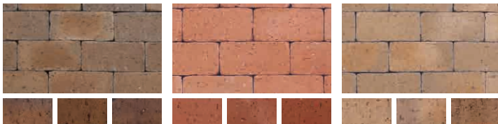
アンチックシルバー