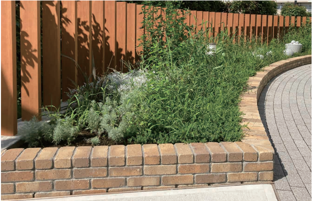
アンチックイエロー