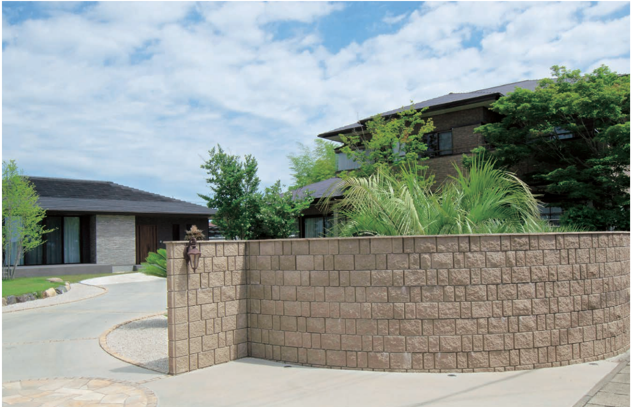
ナチュラルブラウン