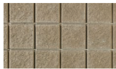
ナチュラルブラウン