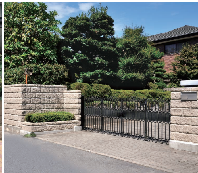
200(スモークブラウン)