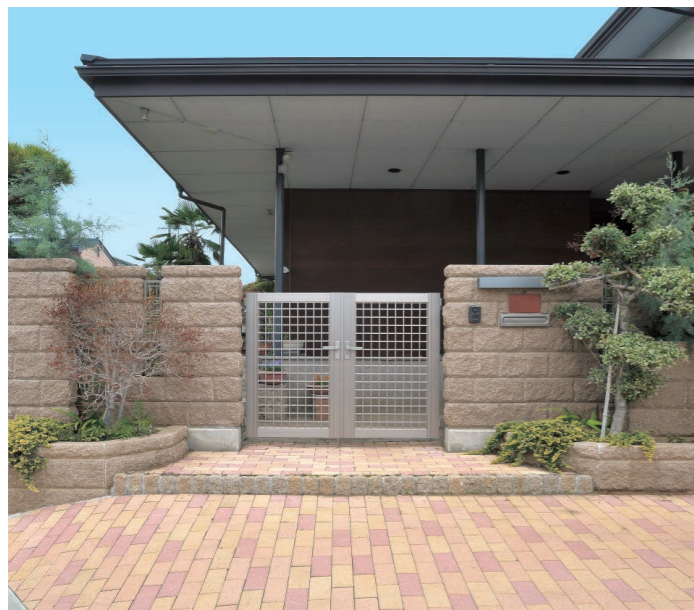
200(スモークブラウン)