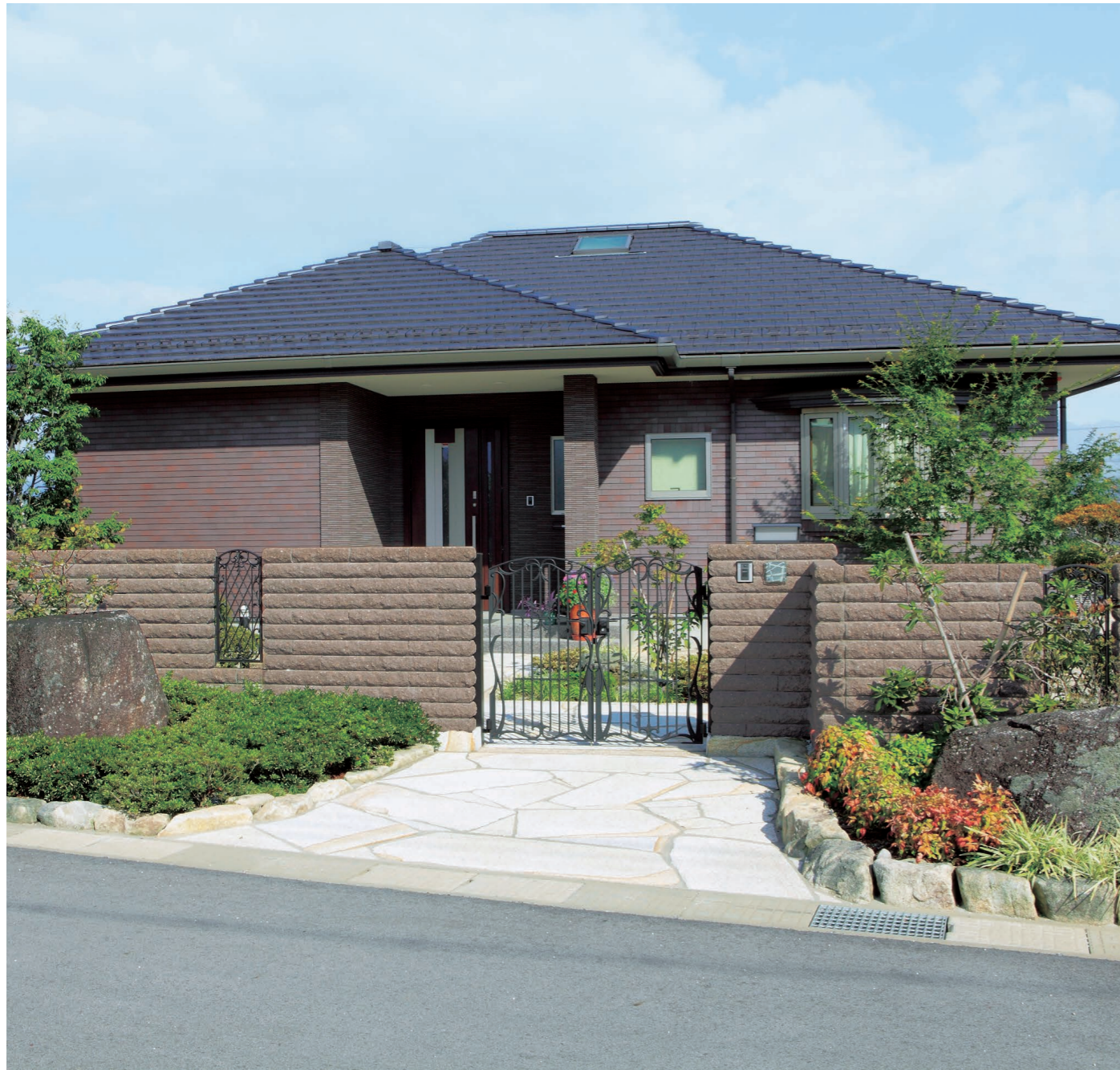
100(スモークブラウン)