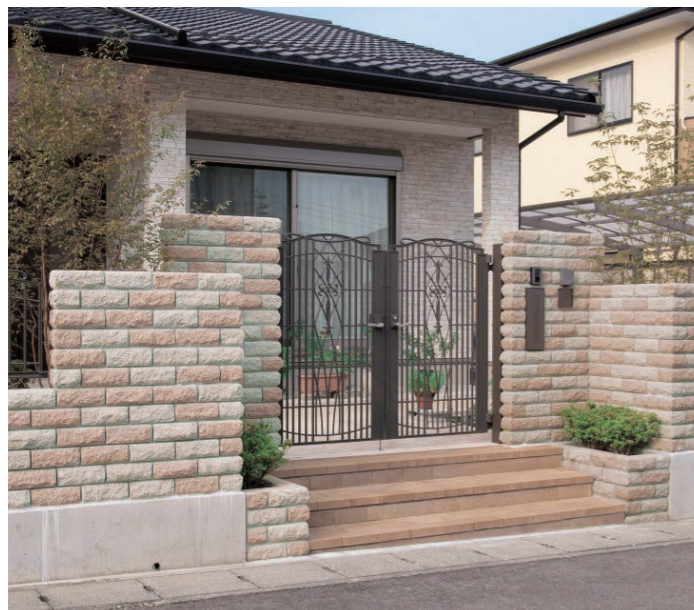
サンドベージュ、ナッツブラウン