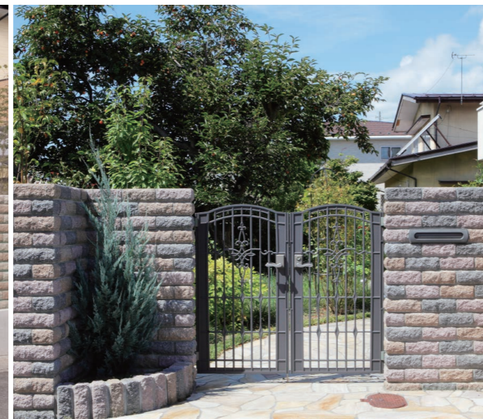
グレー、ナッツブラウン、ロゼ