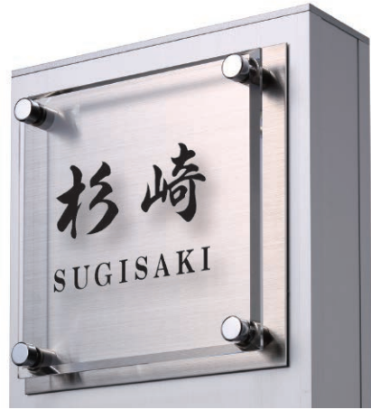
クリアサイン(アクリル+ステンレスヘアライン)