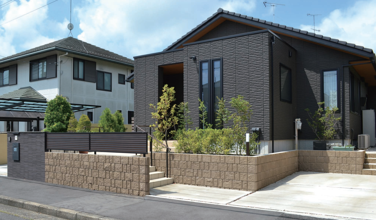
ナチュラルブラウン ※擁壁にはRECOM 2SPを使用しています。