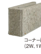
コーナー面 (2W, 1W)