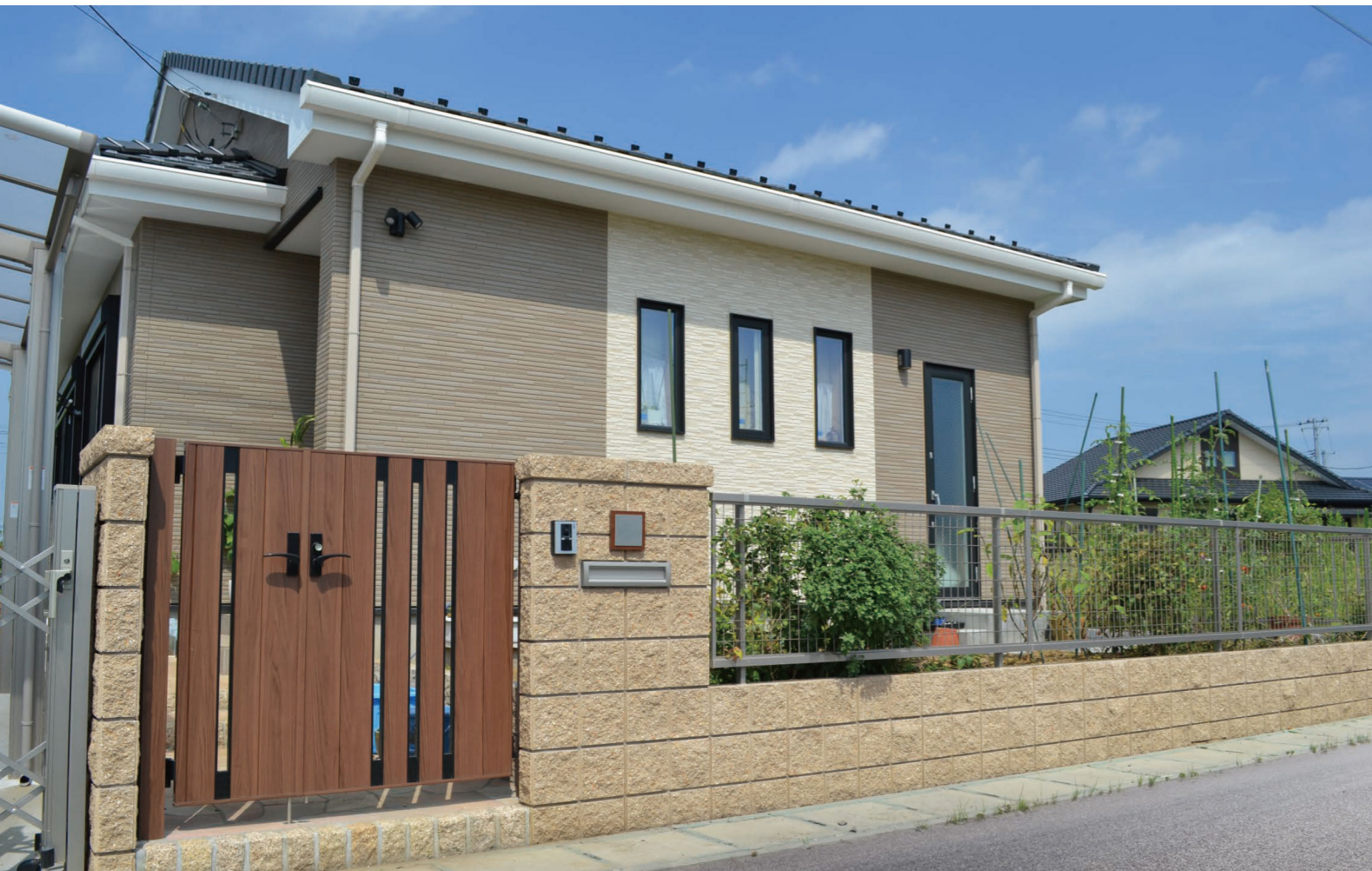
2W(シルキーベージュ)