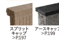
スプリット キャップ >P.197