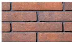
マロンベスロック