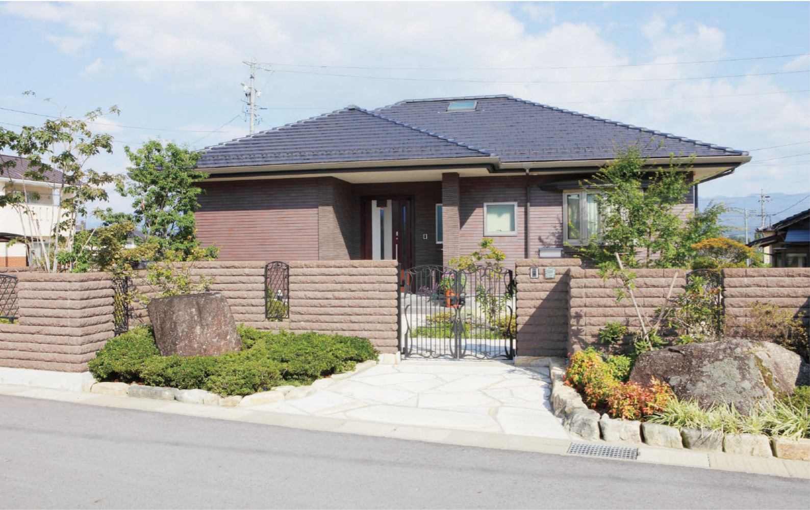
100(スモークブラウン)

ピッチ(こぶだし)加工を施した天然石風のデザインブロックです。それぞれ組み合わせて組積することで、より個性的な壁面を演出します。