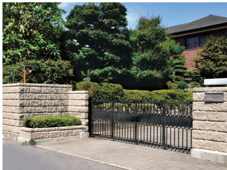
200(スモークブラウン)