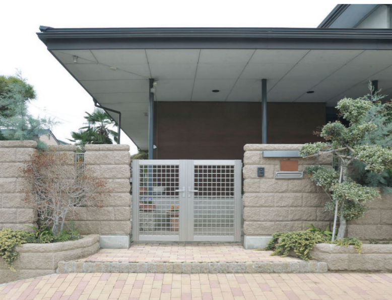
200(スモークブラウン)