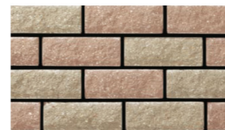
サンドベージュ：ナッツブラウン 1：1