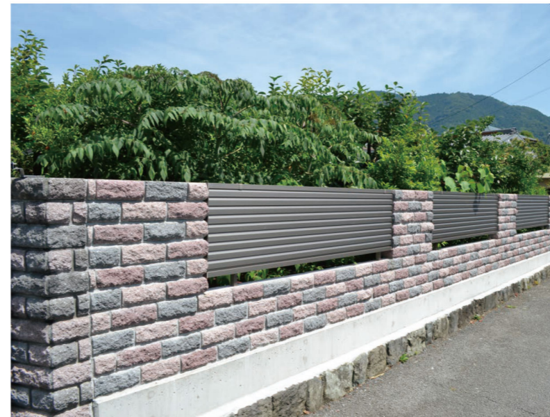
グレー、ロゼ、ワインレッド