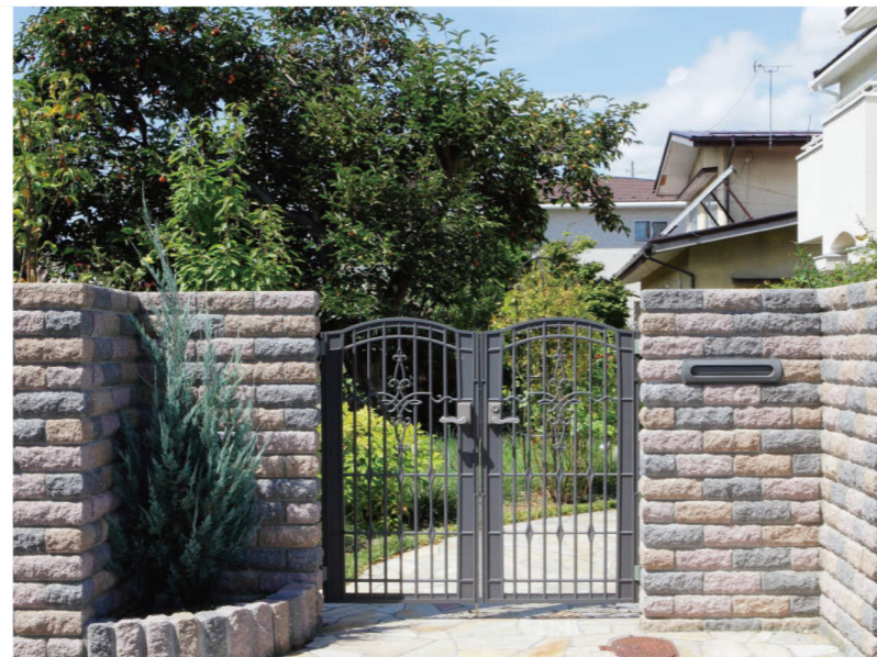
グレー、ナッツブラウン、ロゼ