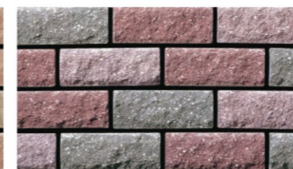
グレー：ロゼ：ワインレッド 1：1：1