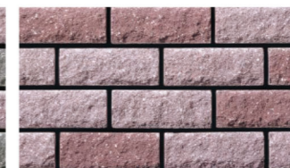
ロゼ：ワインレッド 3：2