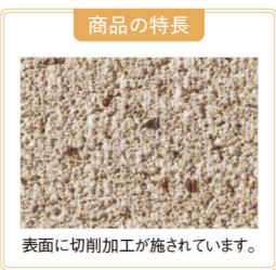
商品の特長 表面に切削加工が施されています。