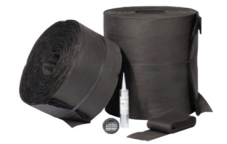
宅地擁壁用透水マット

( )内は正味厚さの寸法です。 ※RECOM2SPの基本形横筋、ハンチ用、水抜き用には、Aタイプ・Bタイプの2種類の意匠があり、両タイプが混在して納品されます。 発注時にタイプの指定はできませんので、ご了承ください。 ・150、180、200の全サイズに、上記の7品種をラインアップしております。 ※1/2サイズのユニットはカット製造をしています。施工時は目地および長さ方向の調整を行ってください。