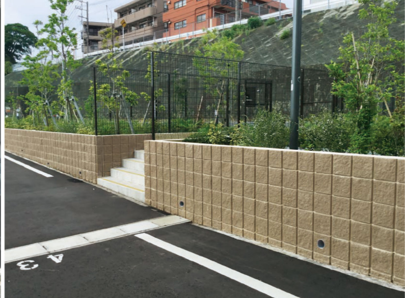
ナチュラルブラウン