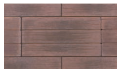
オールディーブラウン