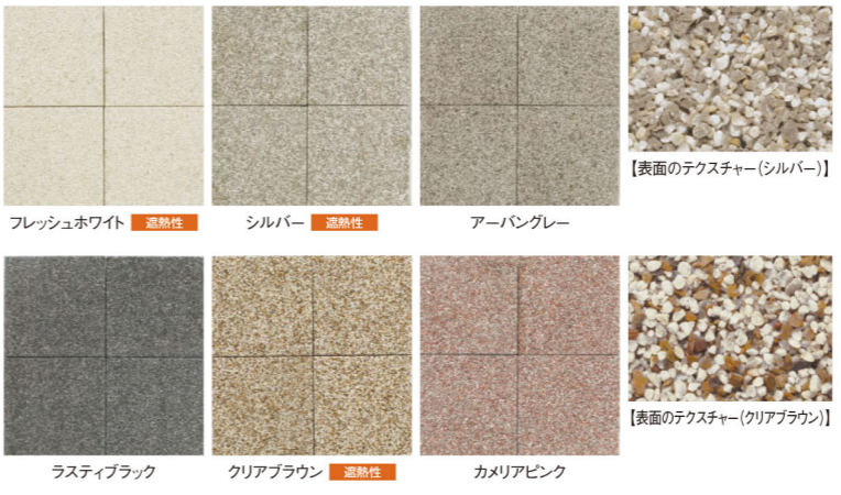
フレッシュホワイト 遮熱性 シルバー 遮熱性 アーバングレー ラスティブラック クリアブラウン 遮熱性 カメリアピンク 【表面のテクスチャー(シルバー)】 【表面のテクスチャー(クリアブラウン)】

ソルベのフレッシュホワイト、シルバー、クリアブラウン色は (一社)インターロッキングブロック舗装技術協会の定める クールブロックベイブ®の認定品です。