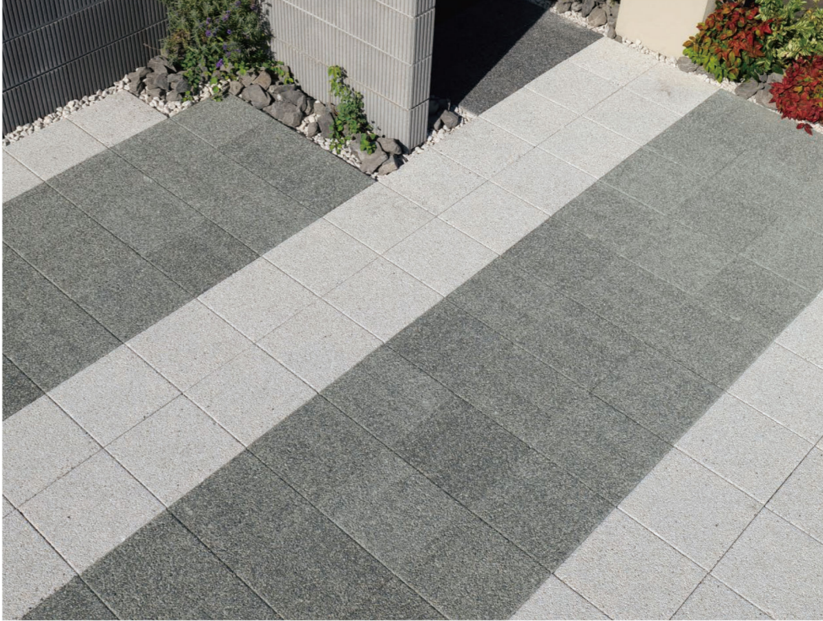
フレッシュホワイト、ラスティブラック