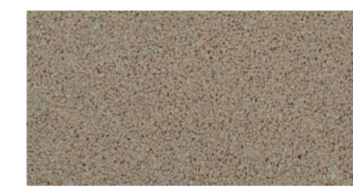
【表面のテクスチャー】