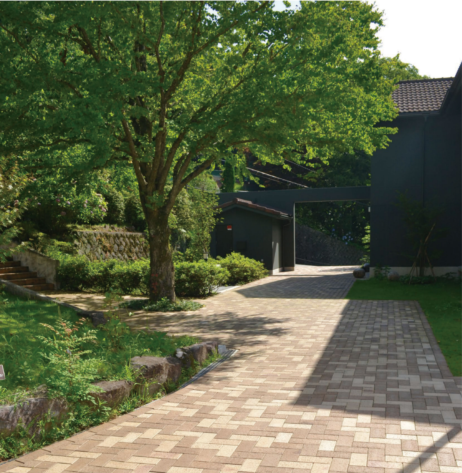
オーランド、カプチーノ