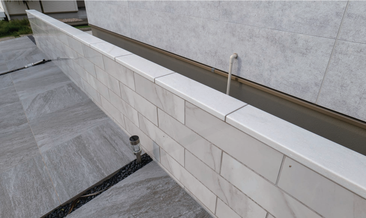
スパークホワイト

研磨仕上げによる輝きのある天然石笠木です。400タイプと500タイプの2つのモジュールサイズに対応できます。