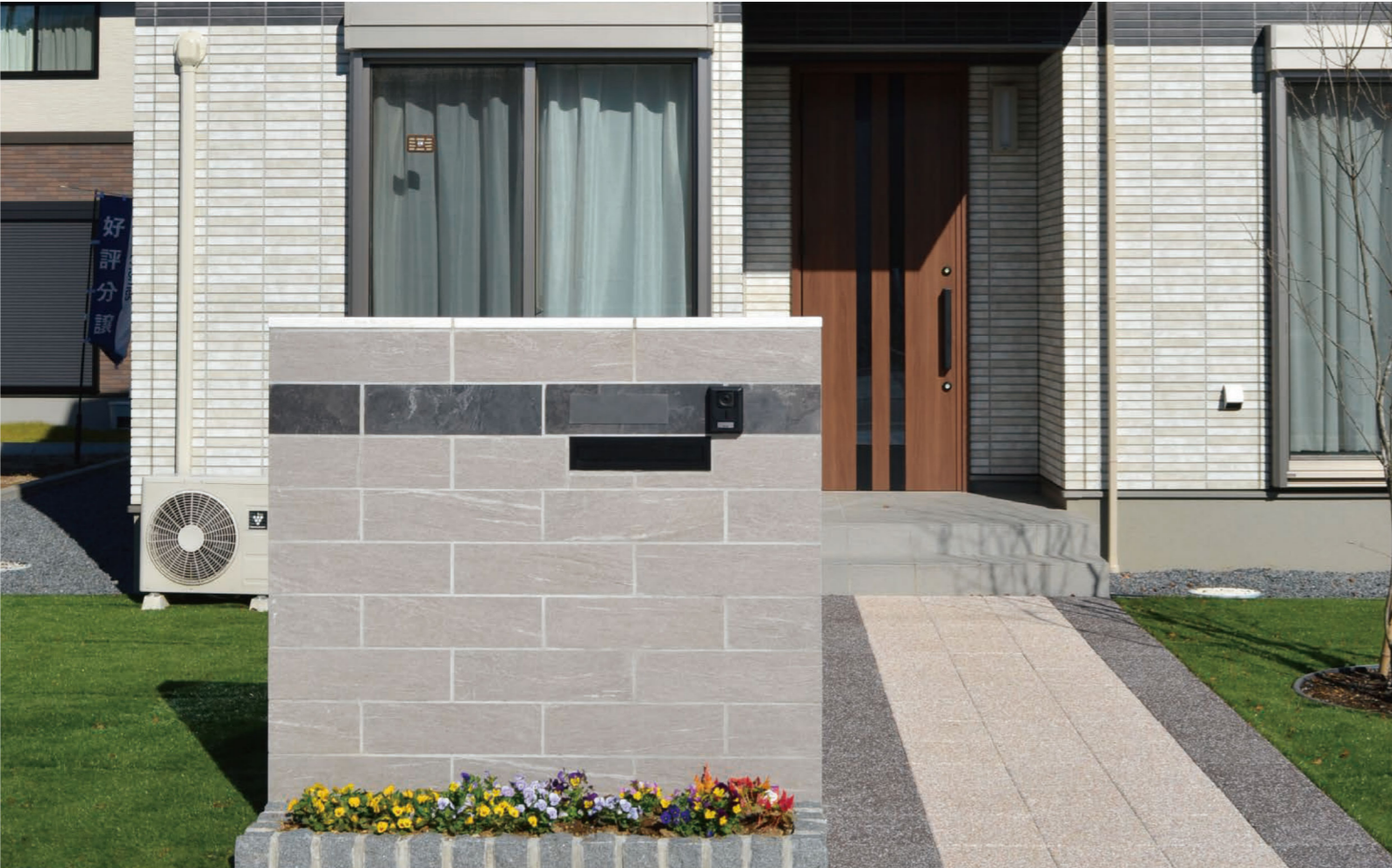
クレスト、アルデシア

美しく高級感を放つタイルとコンクリートブロックの融合商品。タイルの上質感は、住まいに華を添えます。