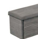
笠木取付イメージ