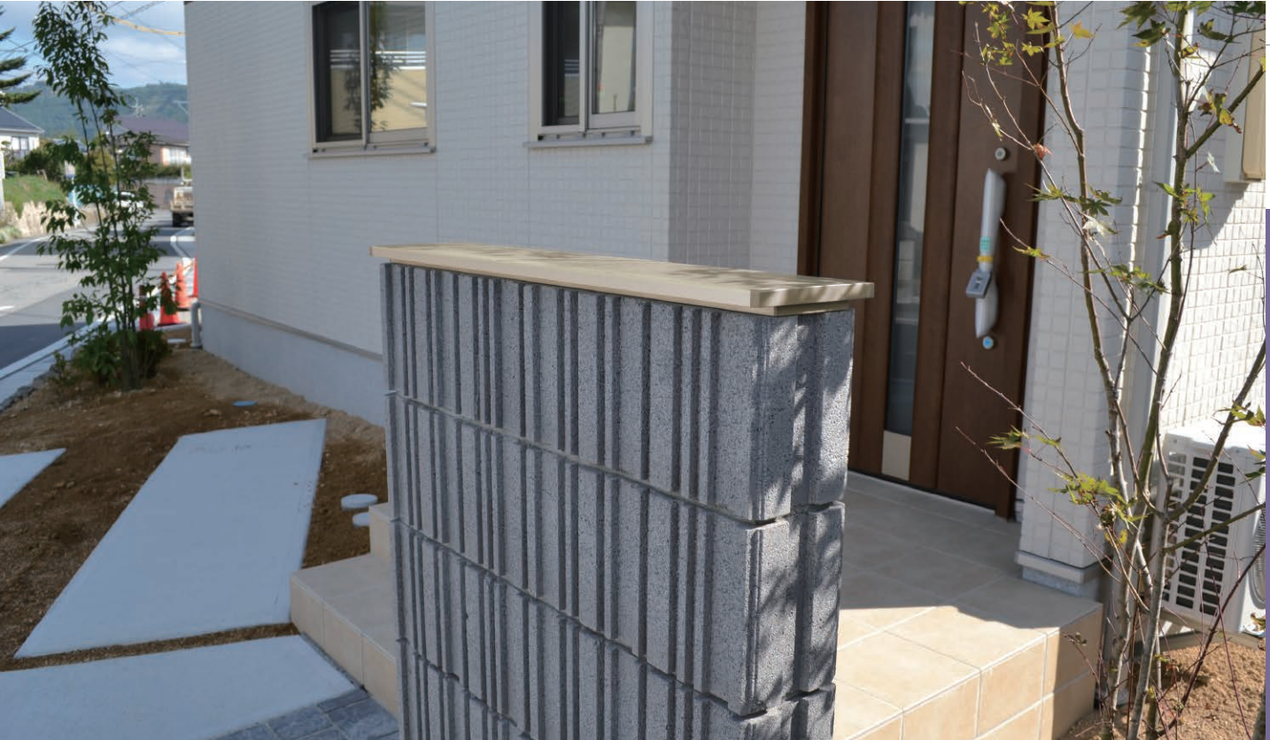
シャンパンゴールド