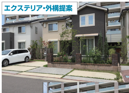
エクステリア・外構提案