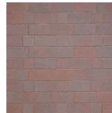
リヨン(N) + リヨン(S) 41.7個/㎡ + 16.7個/㎡