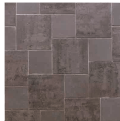
グレー(33) + グレー(22) 7.7個/㎡ + 7.7個/㎡