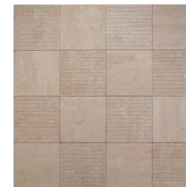
ベージュ(33) + ベージュ(33M) 5.6個/㎡ + 5.6個/㎡