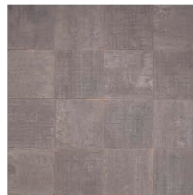
グレー(33) + グレー(33M) 5.6個/㎡ + 5.6個/㎡