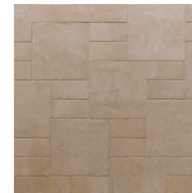
ベージュ(33) + ベージュ(N) 7.7個/㎡ + 15.4個/㎡

・上記使用数量は小数点第2位を切り上げて算出しております。 ・色調は印刷のため、実際と異なる場合があります。