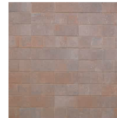
ボルドー(N) + ボルドー(S) 25個/㎡ + 50個/㎡