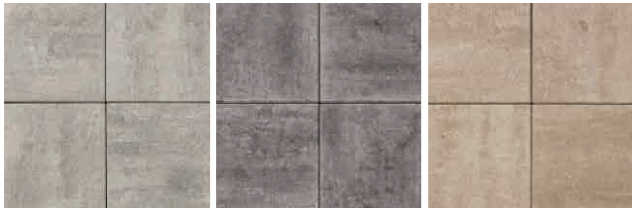
シルバー グレー ベージュ