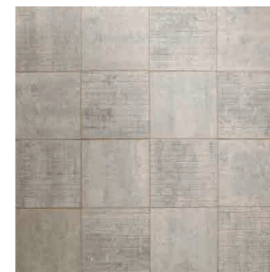
シルバー(33) + シルバー(33M) 5.6個/㎡ + 5.6個/㎡