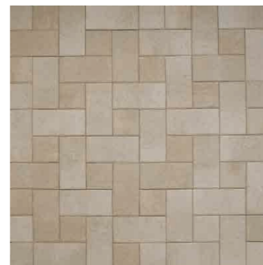
ベージュ(N) + ベージュ(S) 40個/㎡ + 20個/㎡