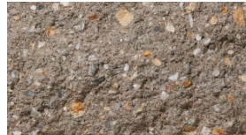
シルキーブラウン