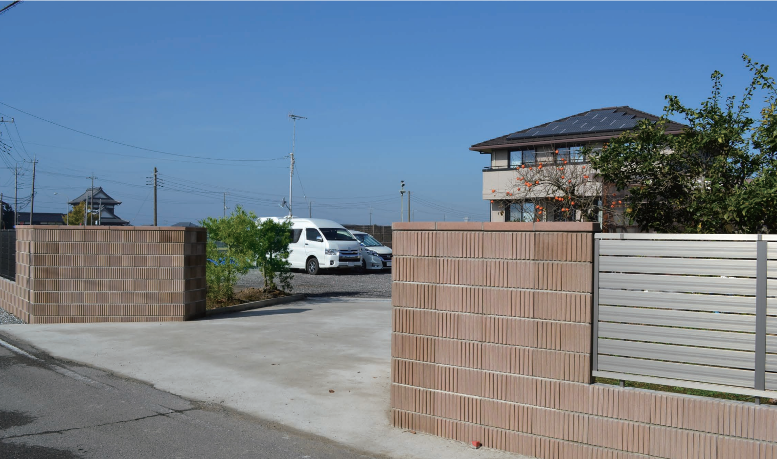
シャドーブラウン