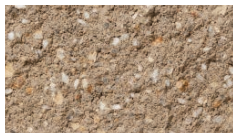
シルキーベージュ