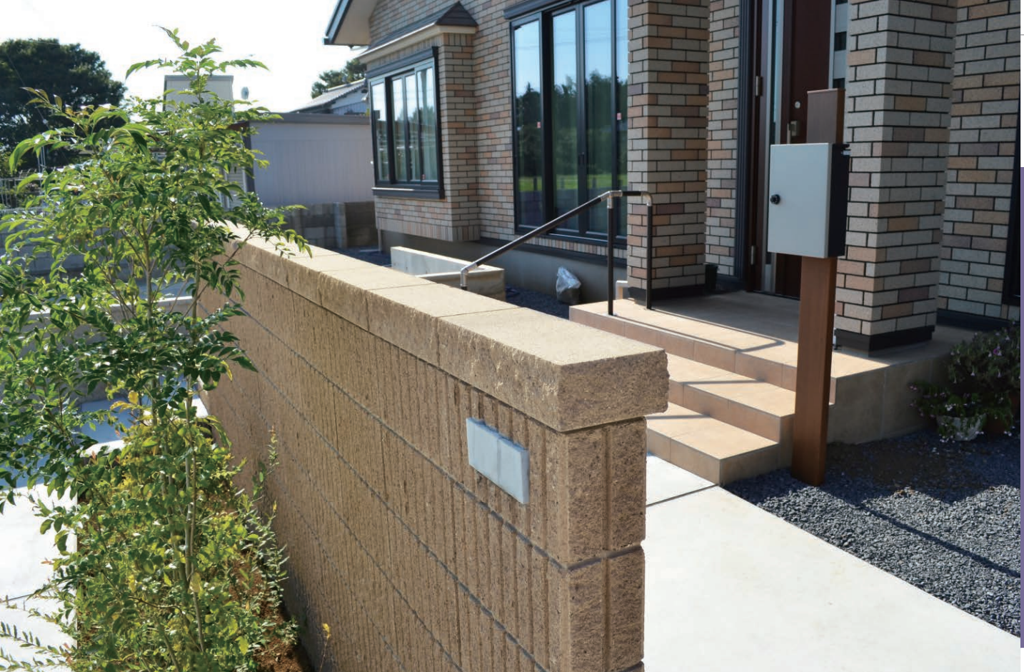
シルキーベージュ