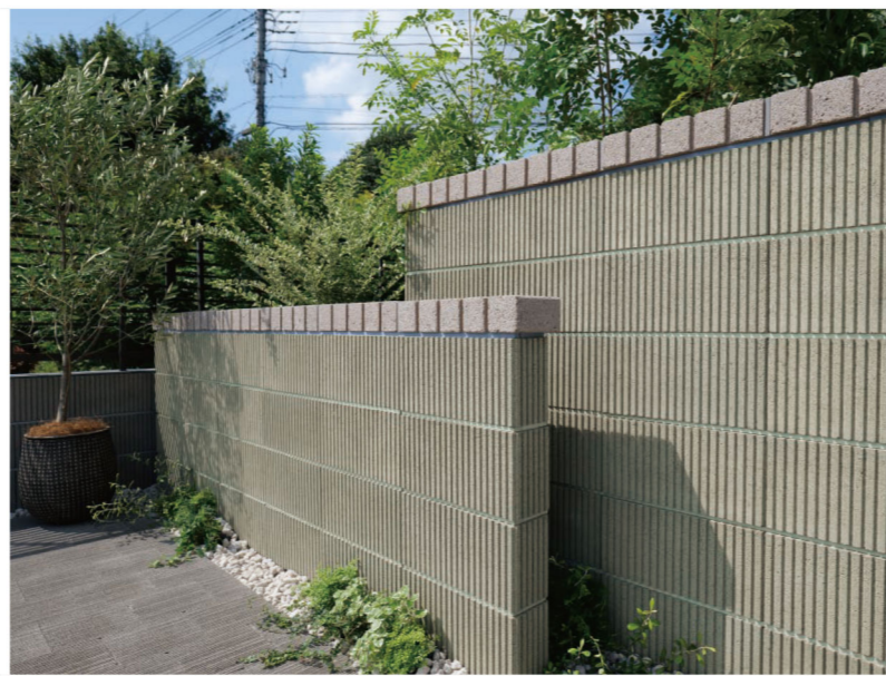
ミルクティーベージュ