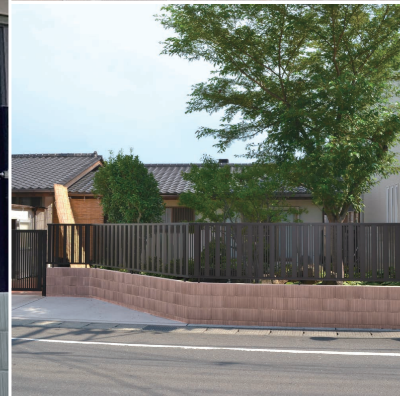
左:ダークグレー 上:ダークブラウン 下:ダークブラウン