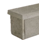
笠木取付イメージ