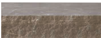
表面:パーナーウォータージェット加工 側面:割肌加工