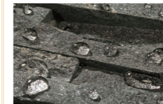
吸水防止加工により、水の浸透を防ぎます。