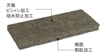
天端 ピシャン加工 吸水防止加工