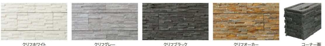
クリフホワイト クリフグレー クリフブラック クリフオーカー コーナー面