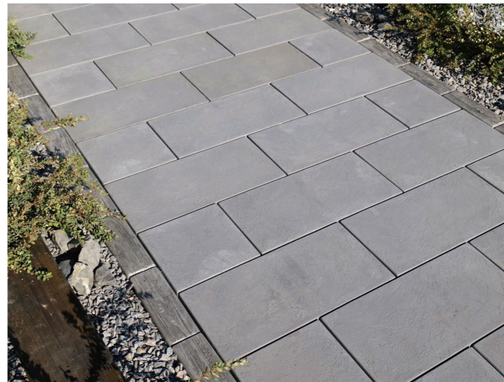
マットグレー(3・3, 6・3)