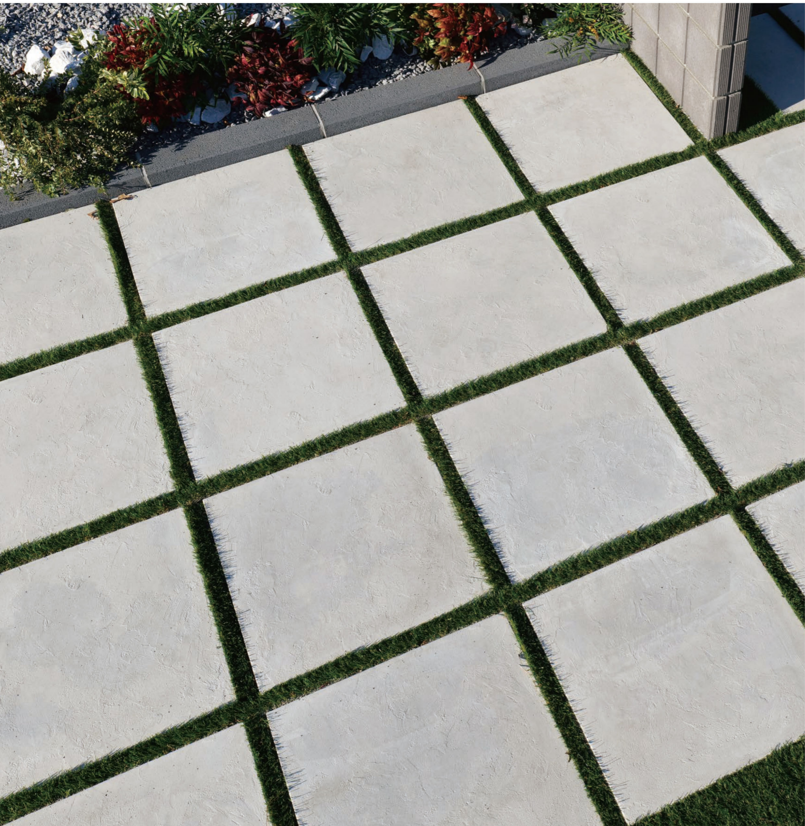
マットホワイト(6・6)