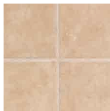
マーブルベージュ