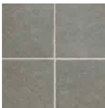
マーブルブラック