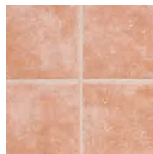
マーブルオレンジ