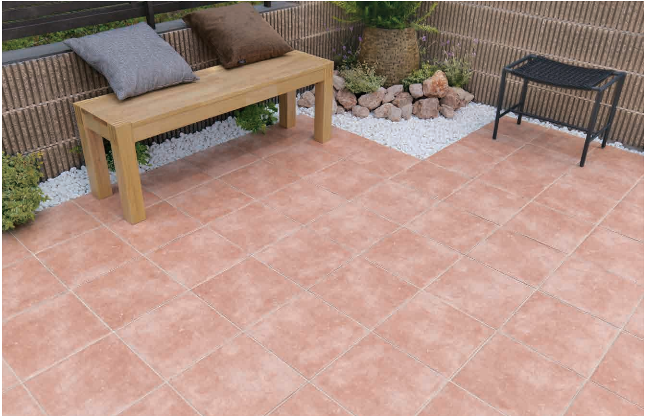
マーブルオレンジ