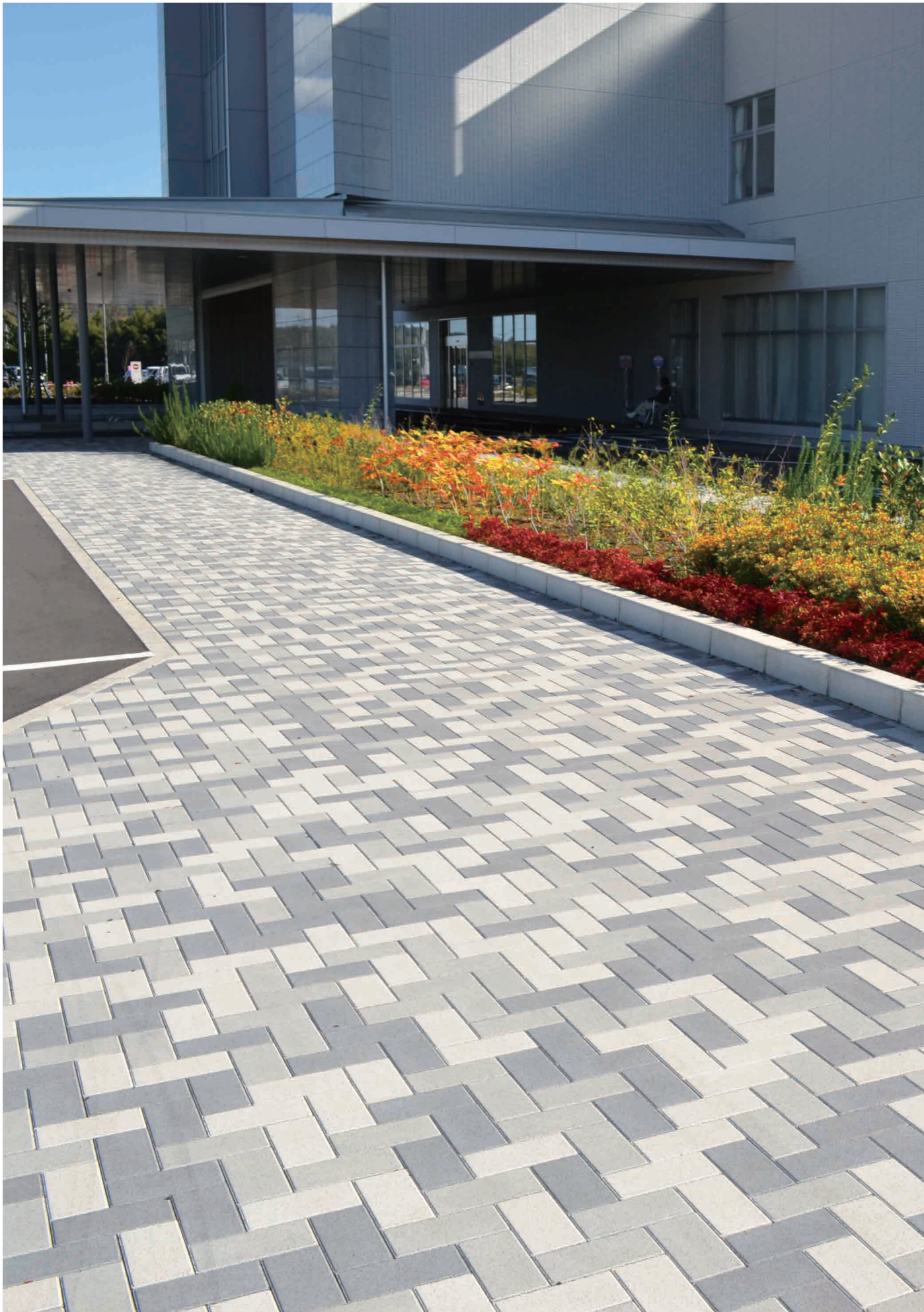
(G-1、G-2、G-3) ※写真はオールラウンドペイブ・スタンダードを使用しています。(イメージ)