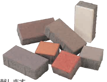
デザインブロック

産業副産物である「高炉スラグ微粉末」を、従来品に比べセメントから多く置換使用することで、CO 2 排出量を大幅に削減したインターロッキングブロックです。地球環境に配慮したまちづくりに貢献します。